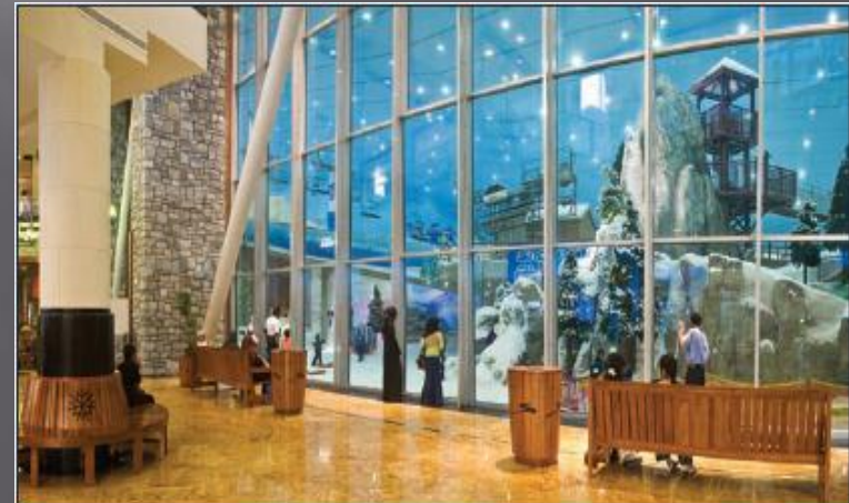
When customers get tired of shopping at the Dubai Mall in the United Arab Emirates, they can go skiing inside!