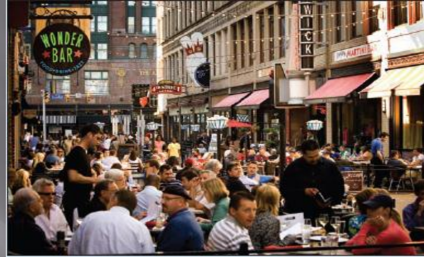
Central Business District

kepadatan tinggi daerah perkotaan yang memiliki kepadatan yang tinggi dengan pendapatan penduduknya rata-rata lebih rendah dari wilayah metropolitan sekitarnya