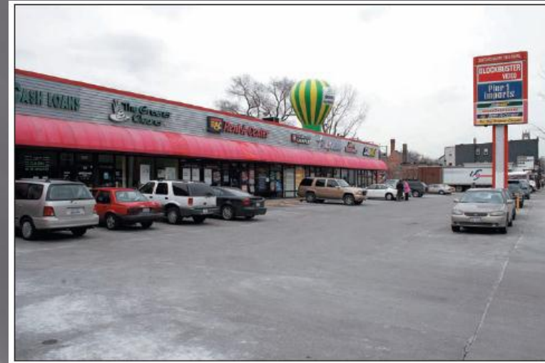
Pusat Belanja Masyarakat sekitar